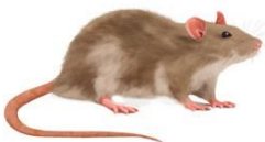
Rata noruega o de alcantarilla